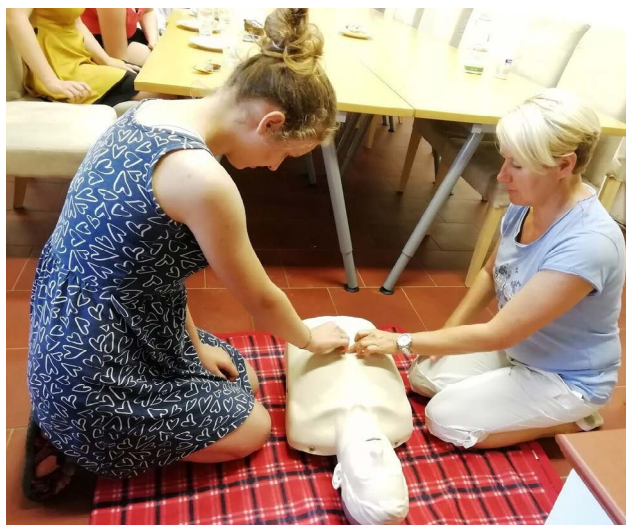
O kurzu první pomoci a péče o nemocné blízké byl velký zájem

Charita plánovala podpořit vznik a následnou činnost svépomocné skupiny neformálních pečovatелů. Myšlenkou bylo pořádání pravidelných setkání pečujících osob v charitní klubovně a vytvoření prostoru pro vzájemnou výměnu zkušeností, sdílení radosti i trápení za účasti moderátorky a sociální pracovníce. Z důvodu velké časové vytíženosti pečujících osob se činnost svépomocné skupiny po několika setkáních ukončila.