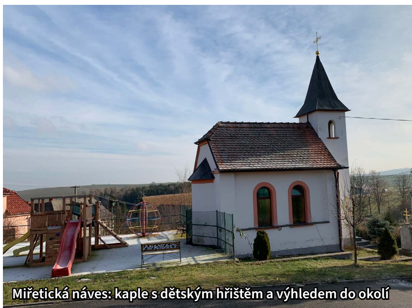
Miřetická náves: kaple s dětským hřištěm a výhledem do okolí

Na to je jednoduchá odpověď. V Miřeticích je spousta aktivních lidí, kteří se