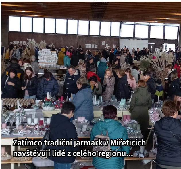
Zatímco tradiční jarmark v Miřeticích navštěvují lidé z celého regionu...