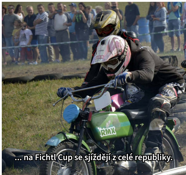
... na Fichtl Cup se sjíždějí z celé republiky.

dokážou nadchnout pro svoji věc. A jako obec se snažíme jejich spolkovou činnost podpořit. Jde třeba o místní Sbor dobrovolných hasičů nebo TJ Sokol, který má dokonce dvě fotbalová mužstva dospělých a tři družstva mládeže. Hrají zde hráči z mnoha okolních obcí. Ve fotbalové soutěži, v níž hraje miřetické áčko, jsme nejmenší obcí a soupeříme s mužstvy z nesrovnatelně větších měst, jako jsou Říčany nebo Sázava.