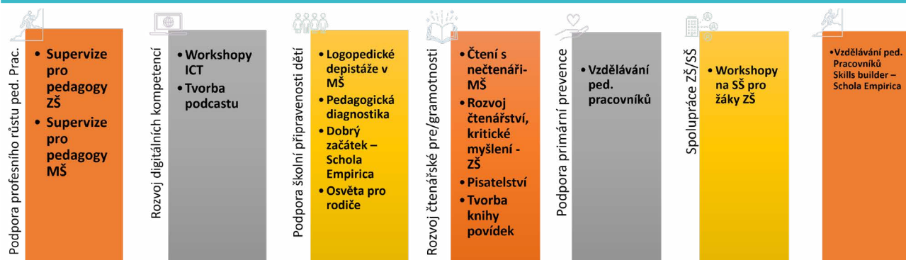
Implementační aktivity MAP IV - grafický přehled