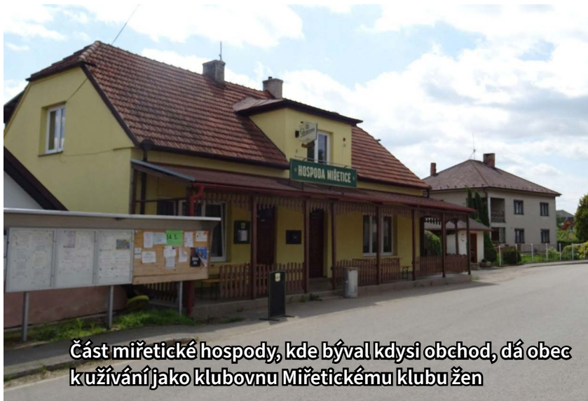
Část miřetické hospody, kde býval kdysi obchod, dá obec k užívání jako klubovnu Miřetickému klubu žen

Použili bychom je především na úpravu veřejných prostranství. Čeká nás revitalizace koupaliště, které bylo hezké ještě před 30 lety. A plány máme s veřejným prostorem kolem hasičárny. Naší vizí zde je zastřešená terasa pro setkávání a workoutové hřiště. ♦