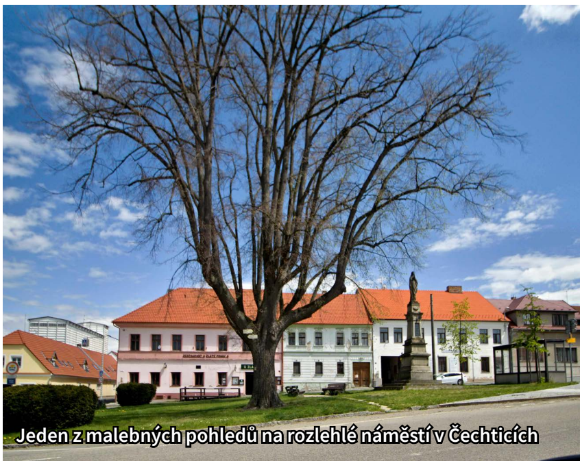
Jeden z malebných pohledů na rozlehlé náměstí v Čechtích

Jako městys provozujete zařízení na likvidaci stavební suti. Je to pro vás hospodářský zisková činnost?