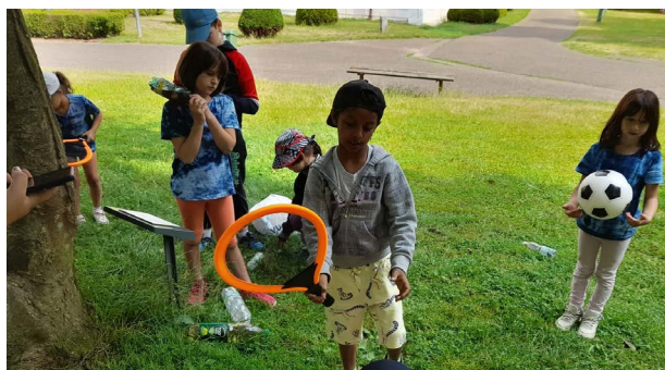
Děti na příměstském táboře klubu Pohoda

I druhá aktivita Diakonie v projektu Společně pod Blaníkem, doučování dětí ze sociálně slabých rodin, je přizpůsobována požadavkům dětí. Doučování je nejčastěji zaměřeno na matematiku, češtinu a angličtinu.