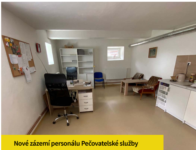
Nové zázemí personálu Pečovatelské služby

Projekt: Modernizace a rozšíření zázemí pro sociální služby