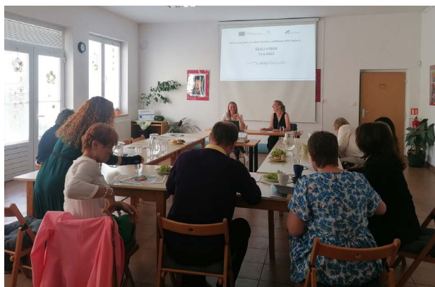
Jednání Řídícího výboru MAP 15. června 2023

Všechny dokumenty jsou dostupné na https://www.masblanik.cz/mistni-akcni-plan-vzdelavani/dokumenty-map/ .