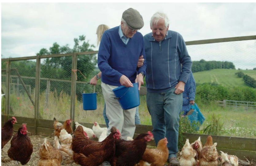
Pobyt a práce na farmě jako způsob péče o ohrožené seniory

V rámci projektu farmy také využily kurzy péče o seniory a zdravotně postižené osoby. Součástí projektu bylo také průběžné poradenství pro pečovatelské farmy, které jim pomohlo přizpůsobit své aktivity specifickým potřebám klientů. Na farmách vzniklo celkem 26 nových pracovních míst pro