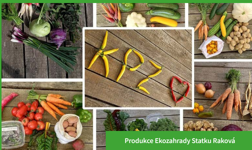
Produkce Ekozahrady Statku Raková

Dalším příkladem podobného modelu je Svobodný statek na soutoku, o.p.s., který na své farmě na jižní Moravě funguje v souladu s principy komunity Camphill.