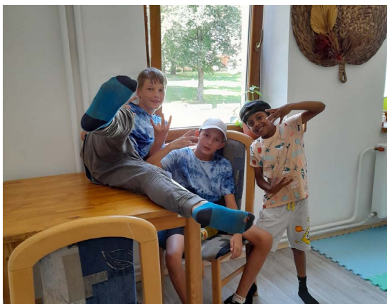
Děti ve volnočasovém klubu Pohoda