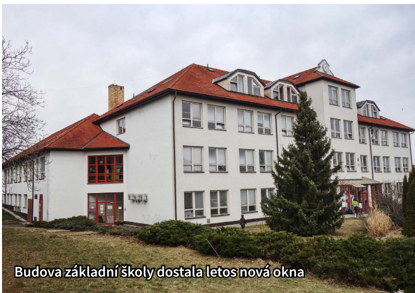
Budova základní školy dostala letos nová okna

Tento projekt teď nerozvíjíme, protože se věnujeme se Spolkem přátel Ferdinanda Čenského plánování naučné stezky právě o Ferdinandu Čenském,