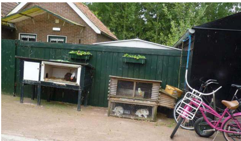
Nizozemská farma sociální péče De Bonte Sik

Projekt měl za cíl vytvoření a provoz 15 pečovatelských farem v 5 okresech Kujavsko-pomořského vojvodství. Pečovatelské farmy mají ubytovací kapacity pro celkem 75 ohrožených osob. Každý účastník projektu mohl využívat služby pečovatelské farmy maximálně půl roku (celkem tak za dobu projektu projekt pomohl 225 klientům). Během tohoto půlroku procházeli senioři ve skupinách čítajících 3 – 8 osob programem rehabilitace, jehož cílem bylo udržet je v dobré fyzické i mentální kondici a udržet jim smysl pro sociální vazby. Farmy zapojené do projektu nabídly různý rozsah aktivit dle zájmů a potřeb svých klientů od čisté zemědělské práce, jako je péče o zvířata nebo zahradničení, až po gymnastická cvičení.