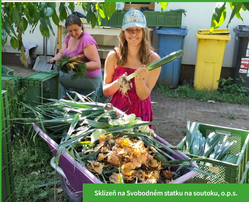
Sklizeň na Svobodném statku na soutoku, o.p.s.

Camphill je označení pro komunity, kde v rodinné atmosféře společně žijí a pracují lidé „běžní“ s lidmi se speciálními potřebami (často nazýváni „s postižením“). Tato společenství jsou budována z podnětů léčebné pedagogiky Rudolfa Steinera. Součástí Camphillu je i provozování biologicko-dynamického zemědělství, s vědomím jeho léčivého působení na krajinu i lidi v ní žijící. Zemědělství má zároveň samozásobitelskou funkci pro Camphill.