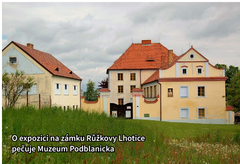
O expozici na zámku Růžkovy Lhotice pečuje Muzeum Podblanicka

Určitě na již zmíněnou rekonstrukci čistírna odpadních vod. ♦