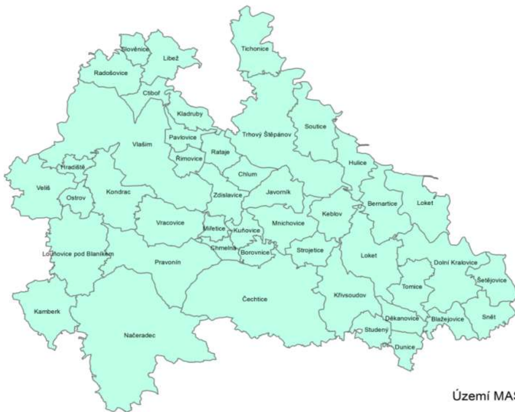
Území MAS Blaník