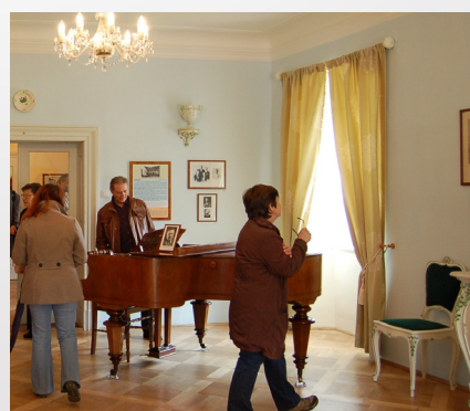
Návštěvníci u Sukova klavíru v nové expozici Kraj tónů