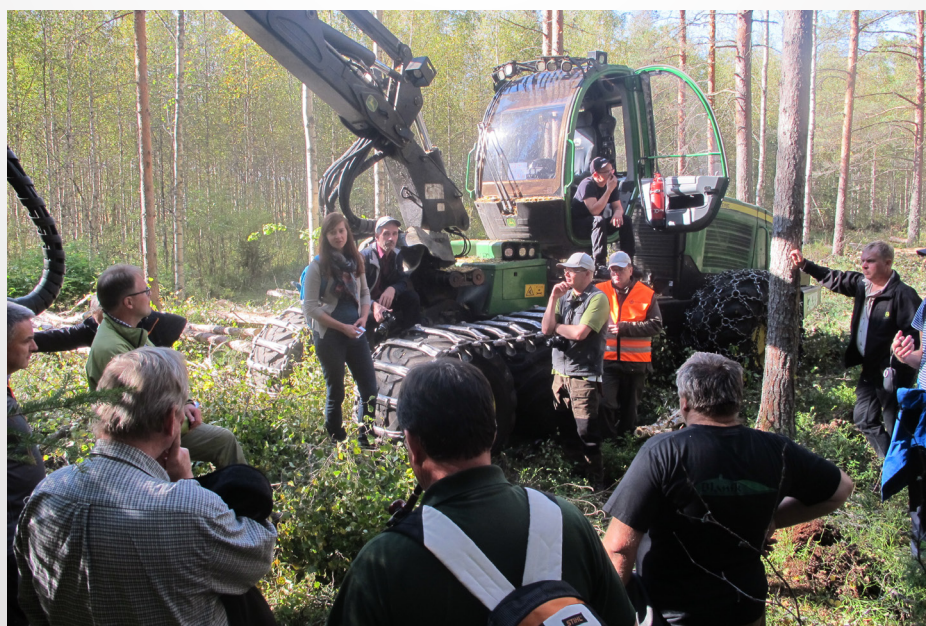
autorka: Eva Hájková