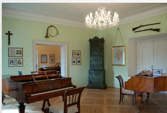
Zelený salon se dvěma klavíry Bedřicha Smetany.

autor: PhDr. Jindřich Nusek, autorka fotografií: Veronika Hanusová