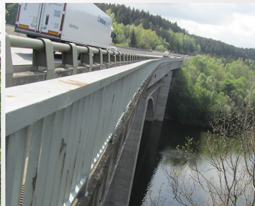
Technická zajímavost dvoupatrový dálniční most u Píště.