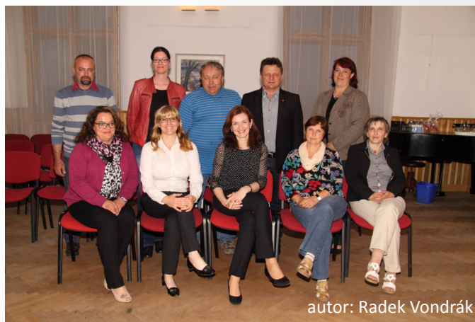
autor: Radek Vondrák

Výběrová komise má 7 členů. Je volena členskou schůzí. Člen výběrové komise nemusí být členem MAS Blaník, z. s. I ve výběrové komisi je nutné zachovat poměr veřejný a soukromý sektor, proto nemohou být ve výběrové komisi více než tři členové z veřejného sektoru. Hlavní povinností výběrové komise je tzv. předvýběr vhodných projektů, hodnocených na základě objektivních kritérií schválených Členskou schůzí. Výběrová komise navrhuje pořadí projektů podle přínosu těchto operací k plnění záměrů SCLLD a předává výsledek své práce dále Výboru.