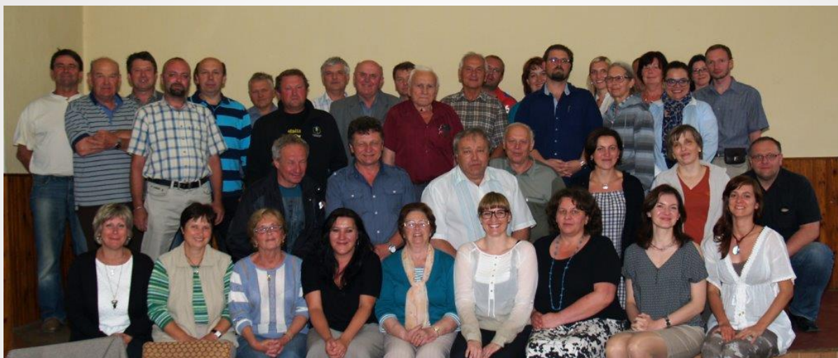
Foto členů: Členská schůze Kamberk 17. 6. 2014