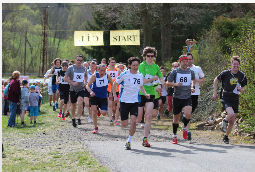
Štěpánovský trháč 25. dubna